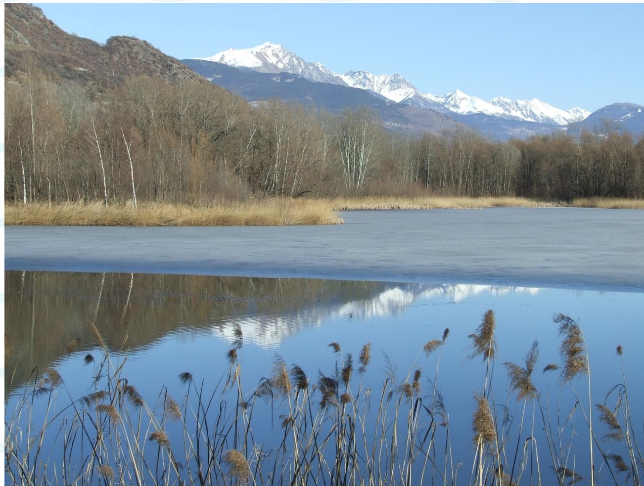
Riserva naturale Les Îles